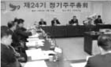
3월 31일 열린 주주총회