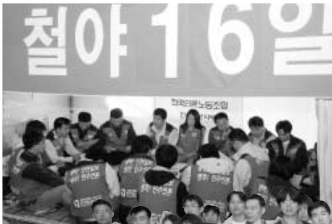
노조 철야투쟁 16일째