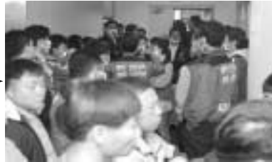
주 총장 밖에서의 노조원