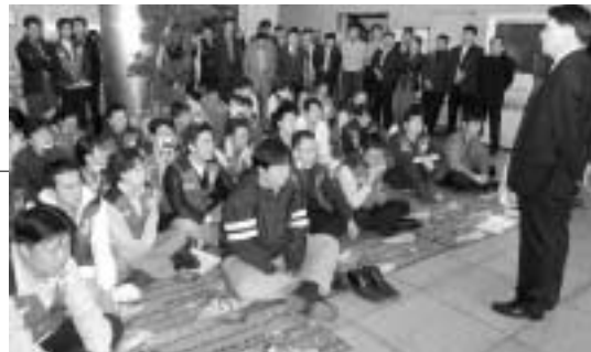
1층 로비 전체직원회의